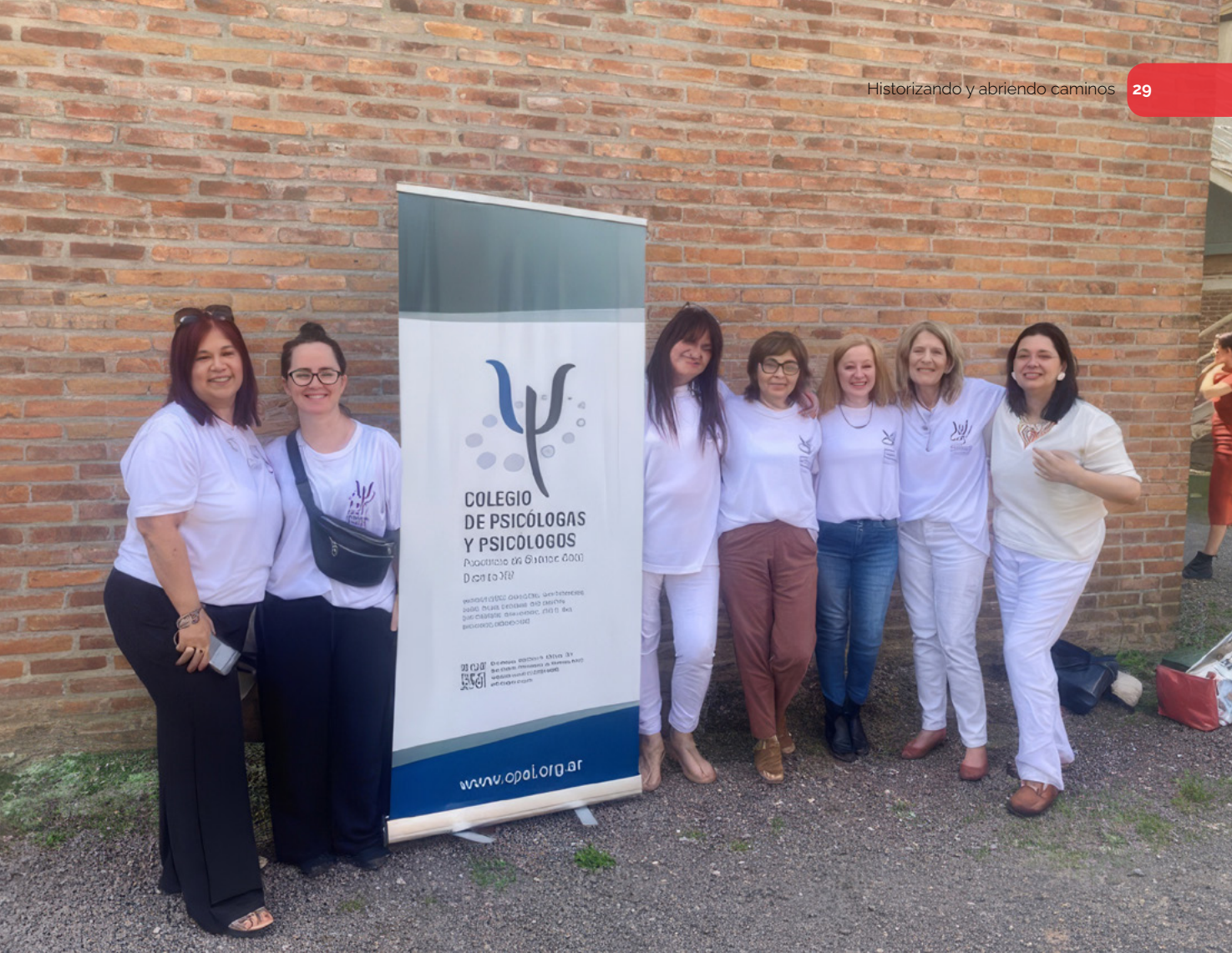
Comisión participando del I° Congreso del Distrito XV. Habitando Prácticas en tiempos Complejos, 30 de Noviembre 2024.

queridos, la disminución de la salud física, la jubilación y la adaptación a nuevos roles.