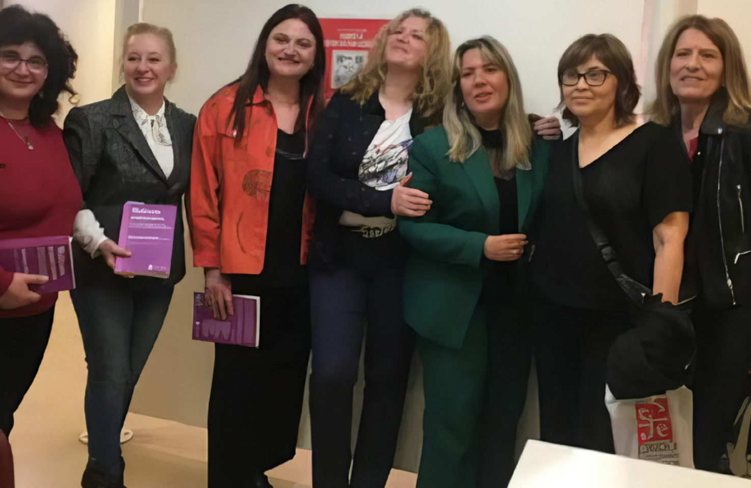
Presentación del libro “Maltrato a mayores”. De la cultura del descarte a la responsabilidad emocional. Octubre 2024.

El proceso de envejecimiento es un desafío constante, ya que no hay una vejez sino vejezes, acompañadas de cambios políticos, culturales y sociales. Se prevé que para el año 2050 las personas de 60 años se dupliquen a nivel mundial.